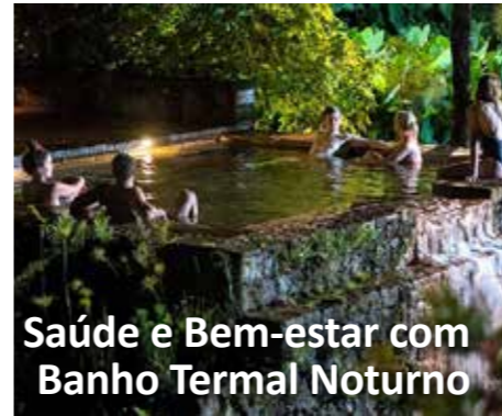
Saúde e Bem-estar com Banho Termal Noturno