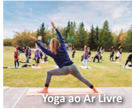
Yoga ao Ar Livre