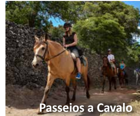
Passeios a Cavalo