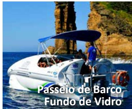
Passeio de Barco Fundo de Vidro