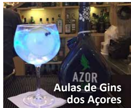
Aulas de Gins dos Açores