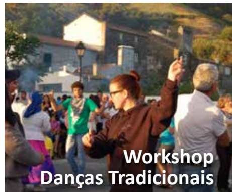
Workshop Danças Tradicionais