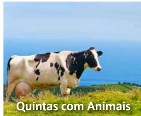
Quintas com Animais