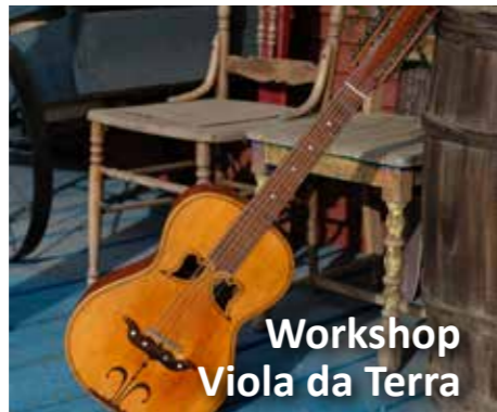
Workshop Viola da Terra