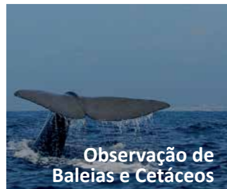
Observação de Baleias e Cetáceos