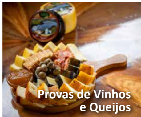
Provas de Vinhos e Queijos