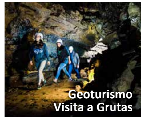
Geoturismo Visita a Grutas