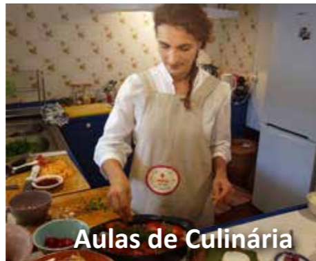
Aulas de Culinária