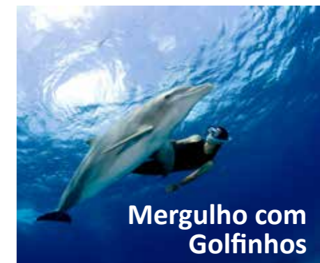
Mergulho com Golfinhos