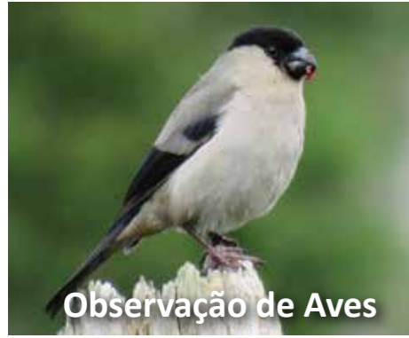
Observação de Aves