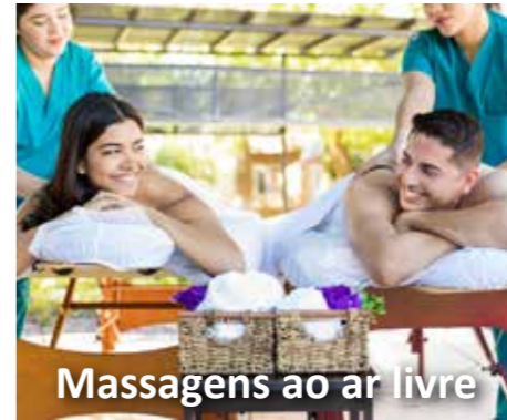
Massagens ao ar livre