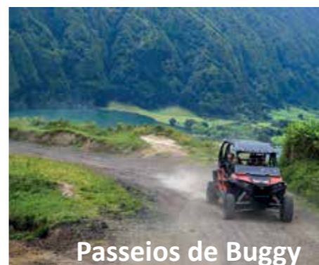
Passeios de Buggy