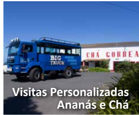
Visitas Personalizadas Ananás e Chá