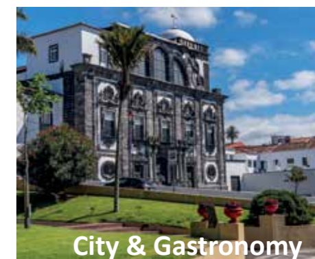
City & Gastronomy