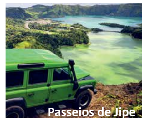
Passeios de Jipe